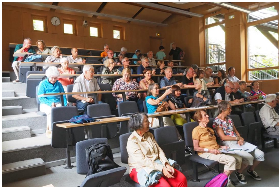
Une cinquantaine d'entre nous sont invités à s'installer dans l'amphi. Redevenir étudiant ! Quelle cure de jouvence !