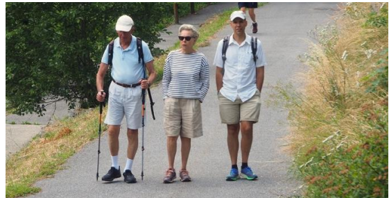
Arrivée en voiture ou à pied.